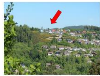
Stadt Triberg i. Schwarzwald Gemarkung Triberg Schwarzwald – Baar – Kreis